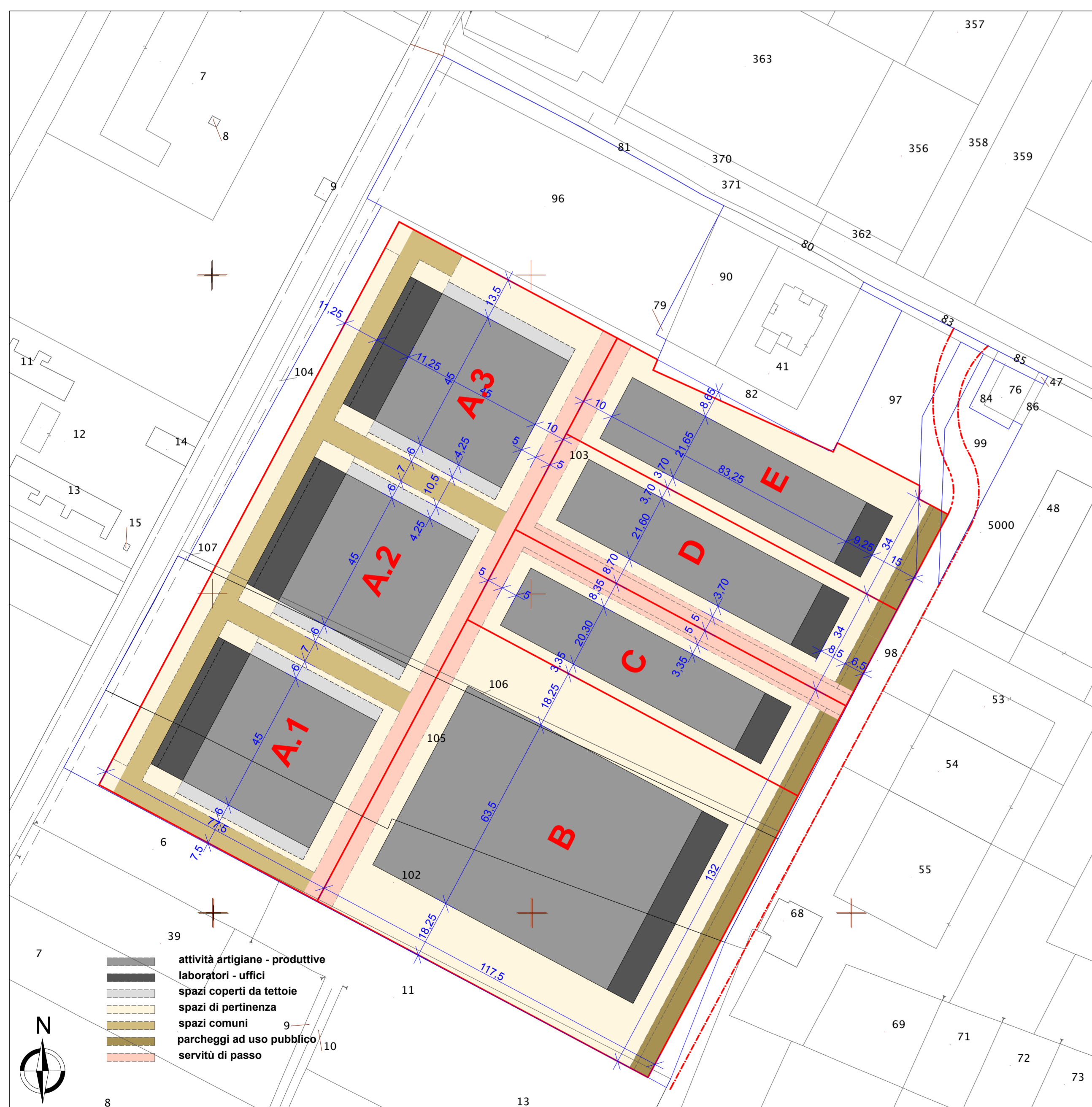
Estratto di mappa catastale con sovrapposta la planimetria generale dei fabbricati e l'area di concentrazione delle superfici utili (SU) degli impianti produttivi