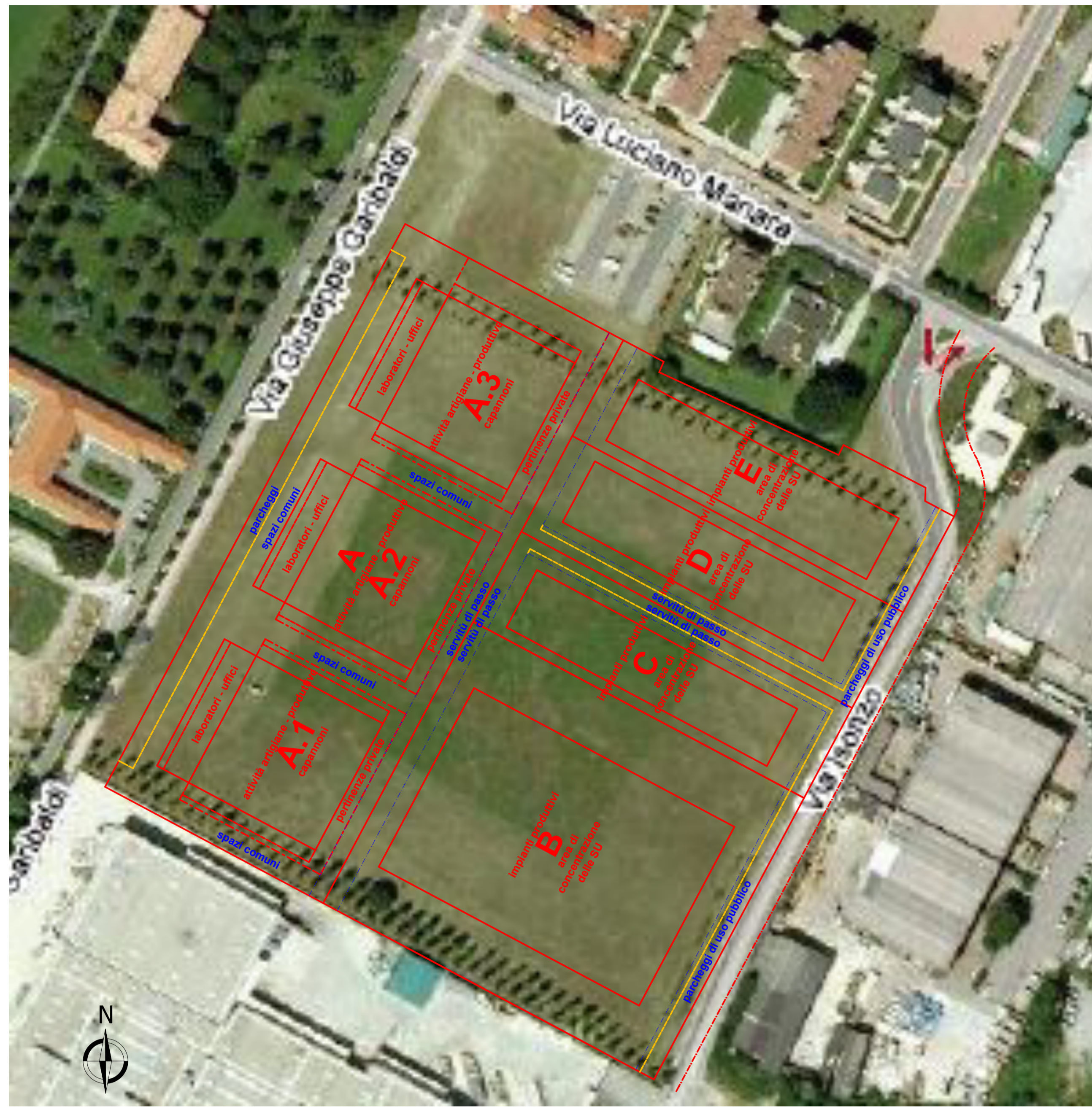
Foto aerea con sovrapposta la suddivisione in lotti e l'impronta a terra dei fabbricati e l'area di concentrazione degli impianti