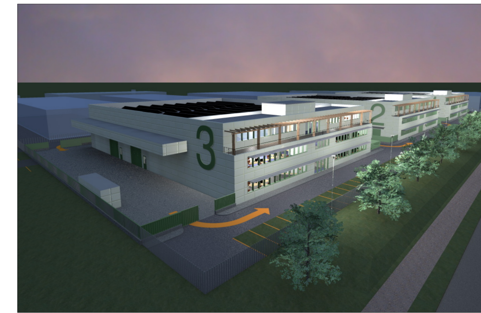
Vista da nord