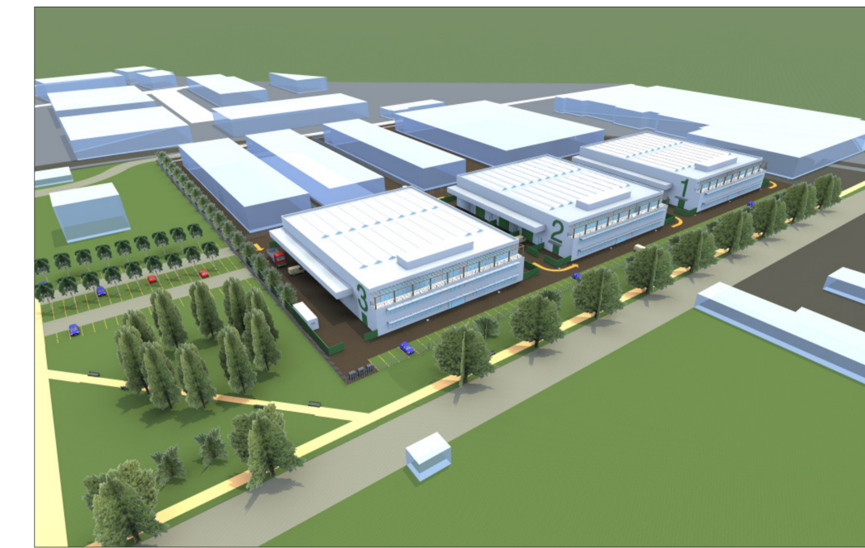
Vista a volo d'uccello sul parco