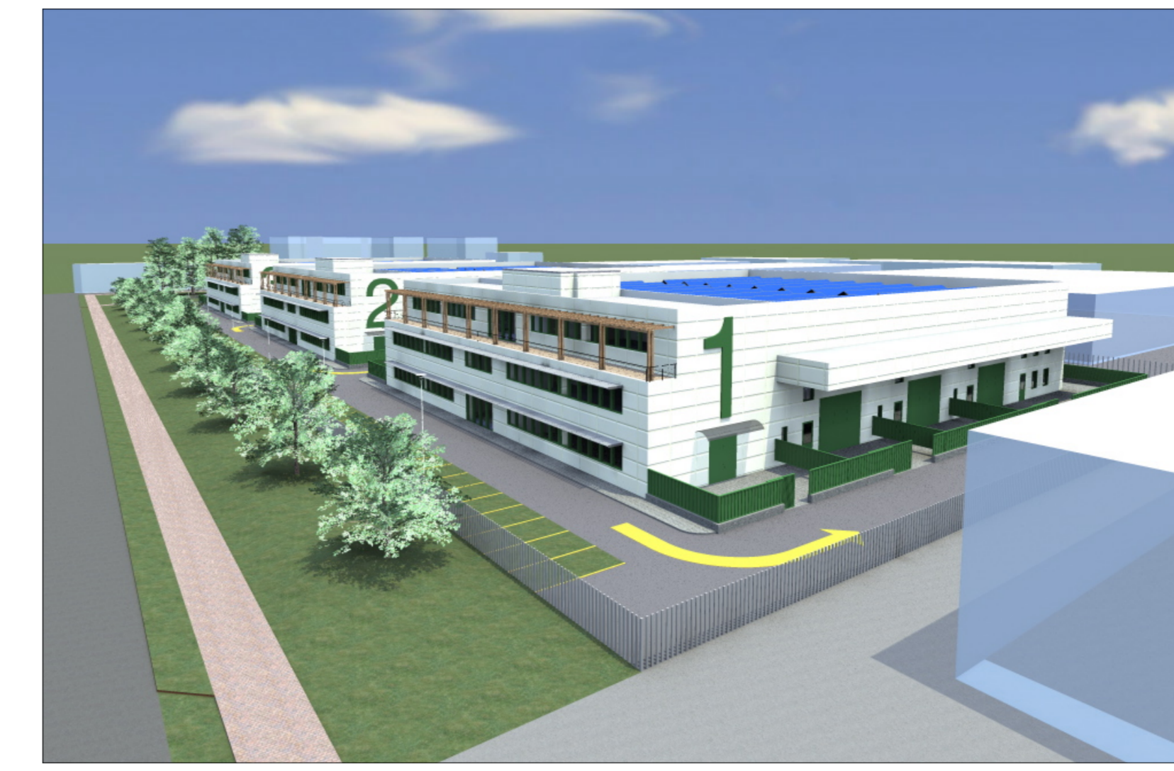
Vista da sud-ovest