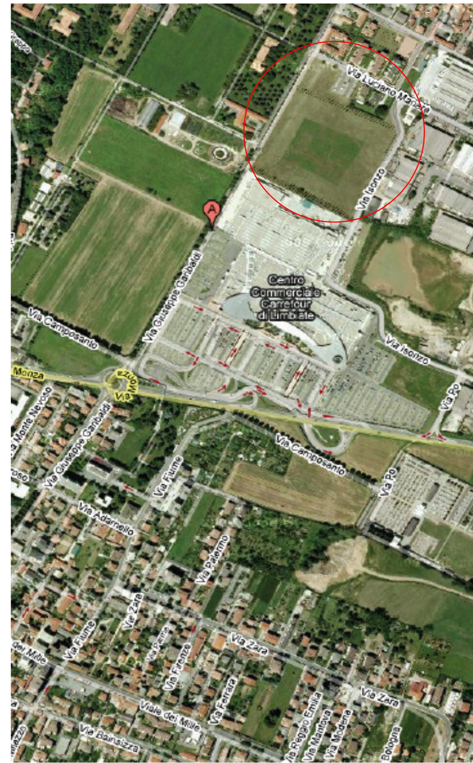
Foto aerea con individuata l'ubicazione dell'intervento