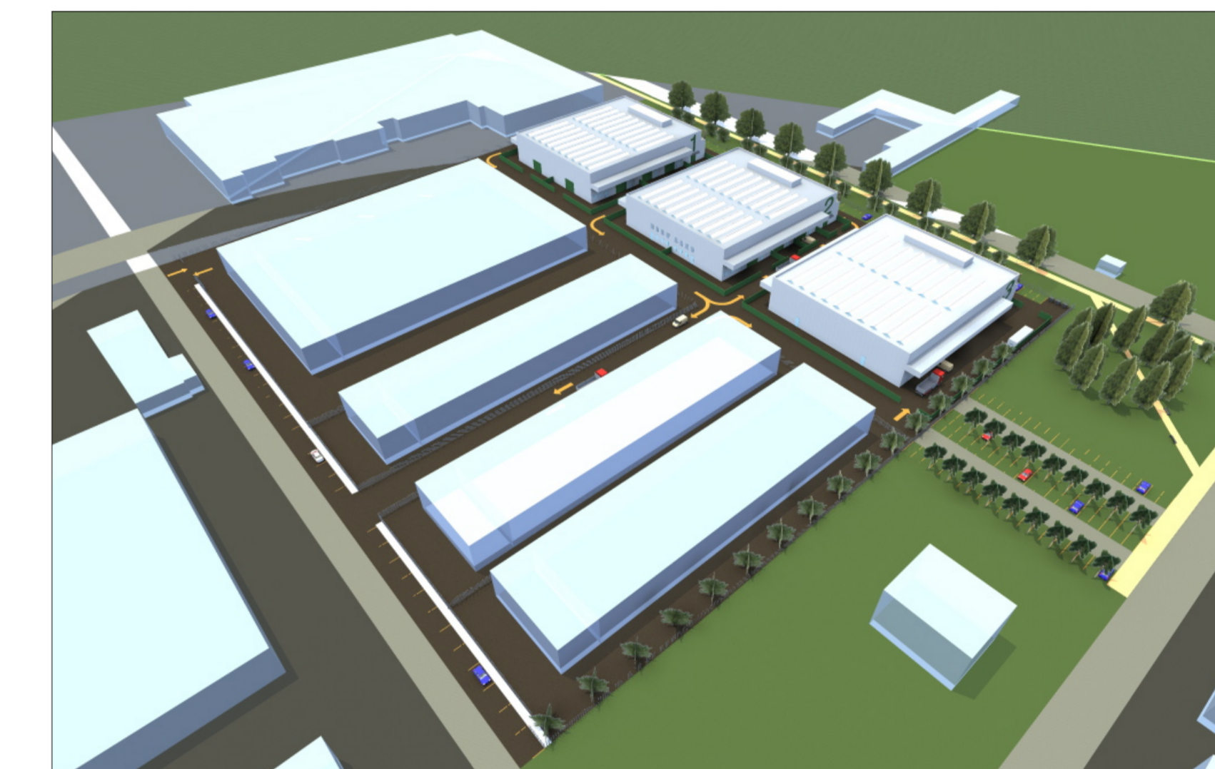
Vista a volo d'uccello su via Isonzo